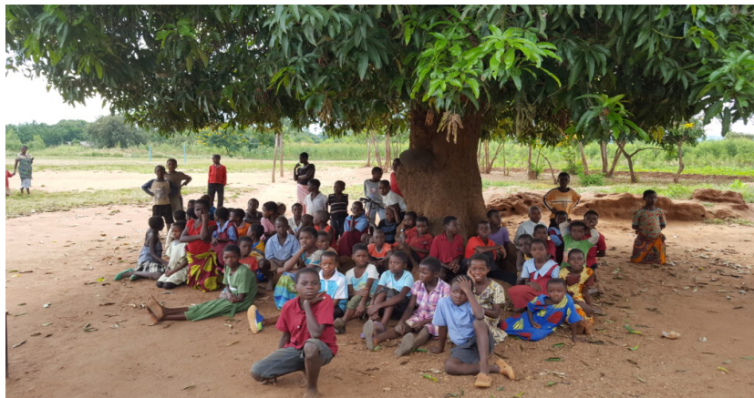
Unterricht unter einem Baum

Im Januar 2022 wurden durch den Zyklon Ana die Dächer von den Schulgebäuden stark beschädigt bzw. im wahrsten Sinne des Wortes ganz weggefegt. Im April 2022 wurden durch YOU ARE NOT ALONE e.V. die Dächer wiederhergestellt, sodass seitdem der Unterricht wieder geschützt stattfinden kann. Die Nachhaltigkeit unserer Projekte ist eines unserer obersten Ziele.